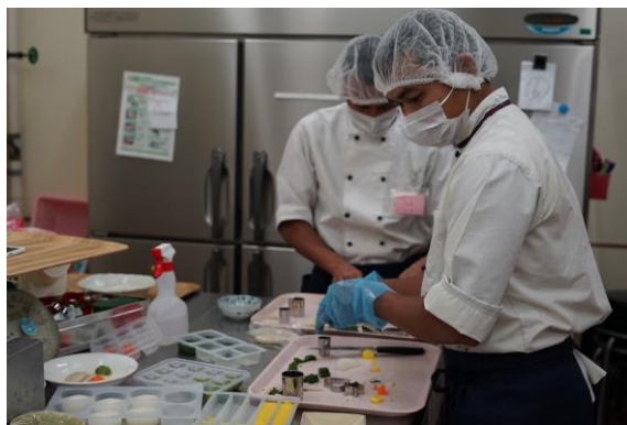
ソフト食調理実習