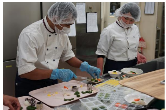
ソフト食調理実習