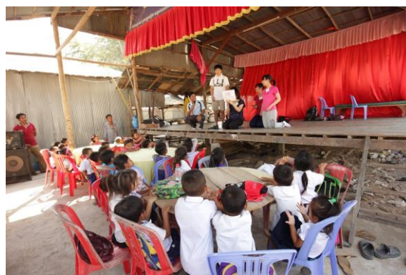
孤児院でのワークショップの様子