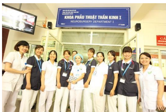
ベトドク病院見学