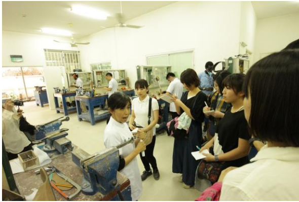
義肢装具センターの見学