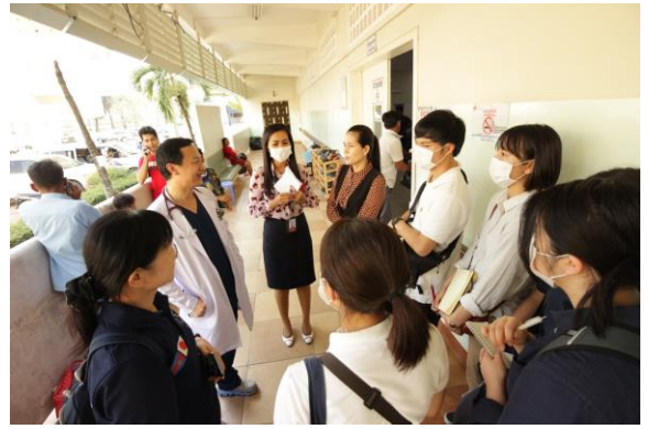
クメールソビエト病院見学