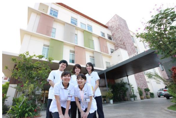
サンライズジャパンホスピタル